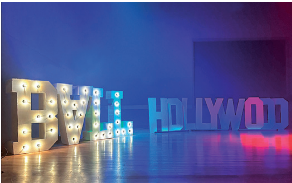
Bühnendekoration: Das Motto des diesjährigen Schulballs war Hollywood.

SchulBALL wird an unserer Schule gross geschrieben. Wortwörtlich im Fall. Und das nicht nur auf dem Papier, sondern auch in riesigen dreidimensionalen, mittels Filamentglühlampen erleuchteter Lettern. Ebenfalls in Grossbuchstaben prangt der ikonische Hollywood-Schriftzug von unserer Bühne, als Motto unseres diesjährigen Schulballs.