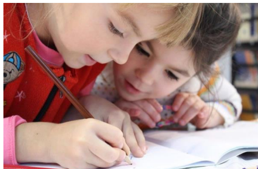
Die Primarschule Bellikon befindet sich im unmittelbaren Strahlungskegel der neuen 5G Antenne

Die Primarschule Bellikon befindet sich im unmittelbaren Strahlungskegel, unweit des geplanten Standorts auf dem Reservoir. Etwas weiter unten ist die Rehaklinik der Suva mit über 200 Betten und rund 1'500 stationären Patienten pro Jahr, dazwischen lebt die Dorfbevölkerung. Mit der neuen Antennentechnik und der Einführung von adaptiven Antennen erhöht sich die Zahl von Spitzenwerten, die mit den heutigen Methoden jedoch nicht gemessen werden können. So kann eine Umgehung der Grenzwerte nicht ausgeschlossen werden und damit erhöht sich die Wahrscheinlichkeit von schädigenden Auswirkungen auf die Schulkinder, Bevölkerung und Patienten der Rehaklinik.