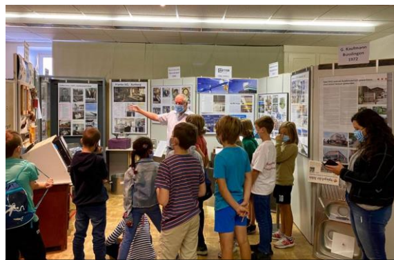
Besuch der 4. Schulklasse von Bellikon