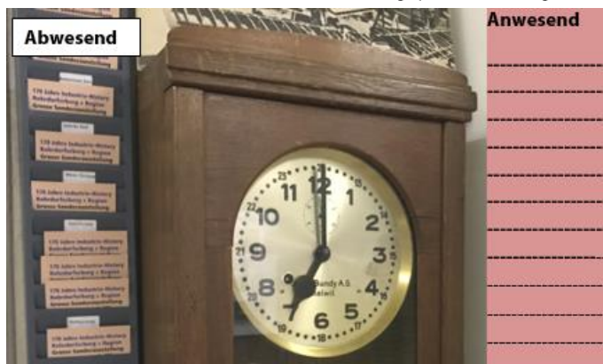
Stempeluhr der Firma Birchmeier Künten, im Einsatz bis 1971

Die Uhr hat in der Vergangenheit vielen Mitarbeitenden ihr zu spätes Erscheinen mit einem „roten Stempel“ nachgewiesen. Im Ortsmuseum haben wir das „Bussen-Kontrollbuch“ der Firma Birchmeier der Jahre 1940 – 1952, darin sind alle verspätet erschienen Personen fein säuberlich notiert. Zudem sind auch Bussen verzeichnet für - Plaudern, Grobheiten, Dummheiten, Absenzen. Aufgeführt sind die Namen, Wohnorte, die Stundenlöhne und die Gründe für die Bussen. So sind viele gängige und weniger bekannte Namen verzeichnet mit Ortschaften von Bremgarten bis Fislisbach und auch links der Reuss liegende Dörfer. Daraus erkennt man die grosse Bedeutung der „Birchmeier Künten“ als Arbeits- und Ausbildungsplatz für die ganze Region (1960 noch 200 Beschäftigte). Dies seit der Gründung von 1876 bis zur Geschäftsaufgabe anno 1994. 1995 übernahm ein mutiger Investor mit gut 30 Mitarbeitenden den restlichen Bereich unter dem neuen Namen Birchmeier Sprühtechnik in Stetten. Mit über 60 Mitarbeitenden werden heute wieder erfolgreich neue hochwertige Produkte hergestellt und verkauft. Ein nächster Artikel wird sich der noch bedeutenderen Firma EGRO in Niederrohrdorf widmen.