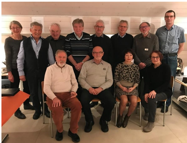
Die Delegierten der 4 Museen freuen sich auf zahlreiche Besucherinnen und Besucher.

Weitere Informationen folgen später in der örtlichen Presse.