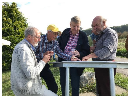
Belliker Prominenz sucht und findet...