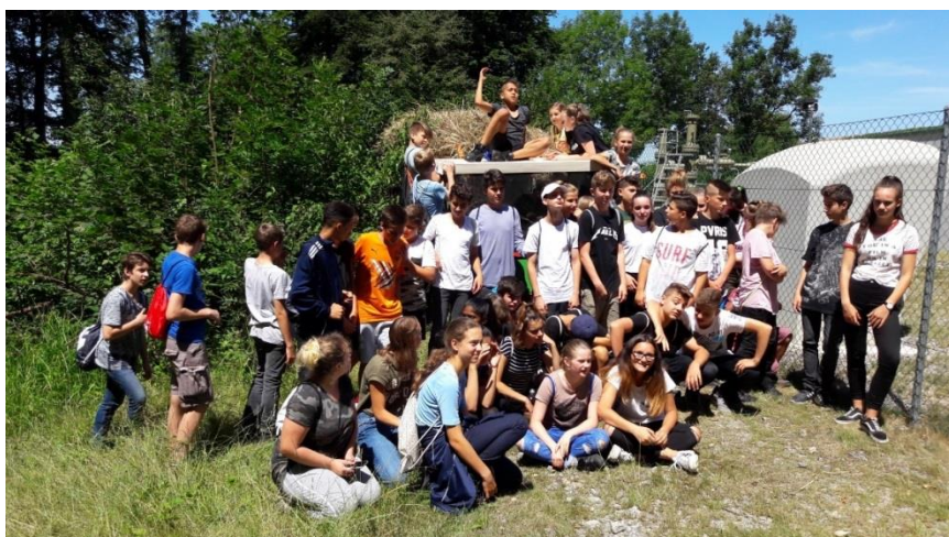
Schülerinnen und Schüler der Kreisschule Mutschellen nach getaner Arbeit im Sommer 2017