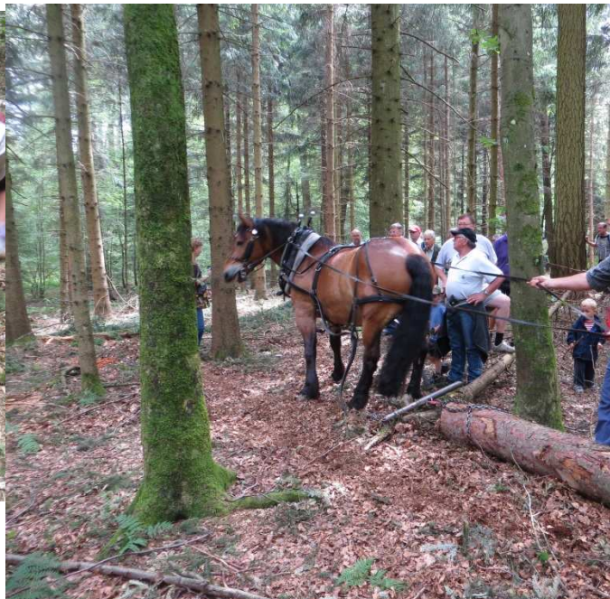
Vorliefern mit Pferd