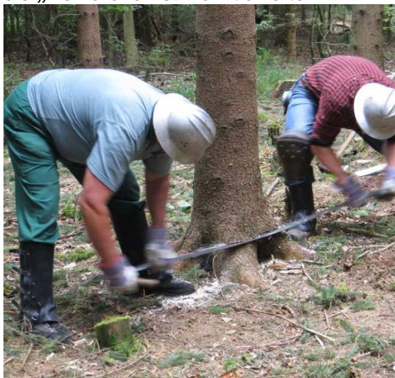
Holzfällen mit Waldsäge