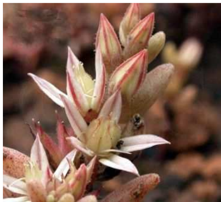
Rötlicher Mauerpfeffer, eine Pflanze, die sich bei der neuen Trockenmauer wohl fühlt