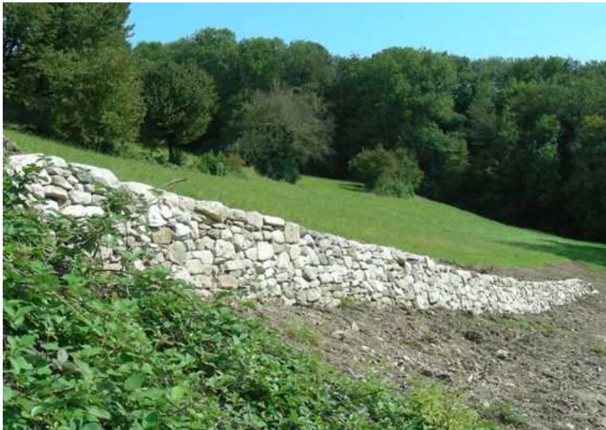
Neue Trockenmauer im Bändelacher