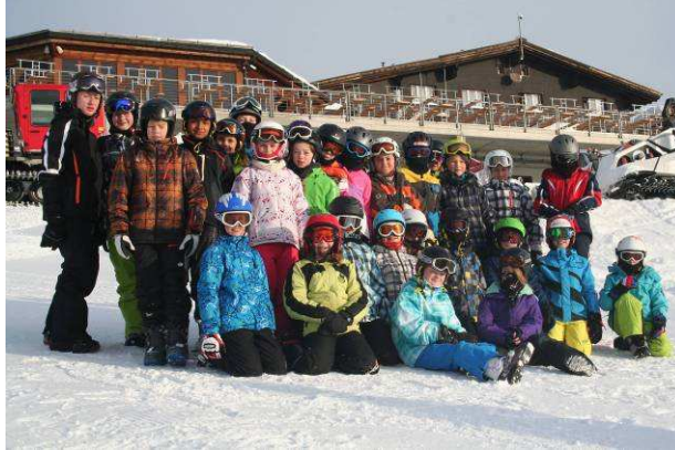
(Legende: Die Kids der 4. und 5. Klasse der Schule Bellikon)

Das diesjährige Skilager fand erneut im tief verschneiten und "winterwonderland-mässigen" Flims/Laax statt. Unsere Unterkunft, die Nagenshütte auf über 2000 Meter ü. M. war auch heuer wieder unser Basiccamp für die ereignisreichen Ski- und Snöbertage.