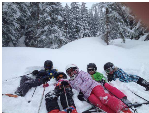
(Legende: kurze Pause in der langen Talabfahrt)

Na ja, fast ausgeruht (noch etwas Müde von der Schnurrerei...) wurde der erste Skitag in Angriff genommen, doch dieser war ja gleich speziell. Man musste vorfahren, damit anschliessend die Gruppen gemacht werden konnten. Nur nicht nervös werden und ja nicht stürzen, war die Devise. Aber das meisterten alle Kinder bravourös. Nun ging es richtig los. Während die Einsteiger das Ski- und Snowboardfahren erlernten und die ersten (Sturz) Erfahrungen machten, waren alle anderen Kids in unterschiedlichen Gruppen auf den Pisten unterwegs.