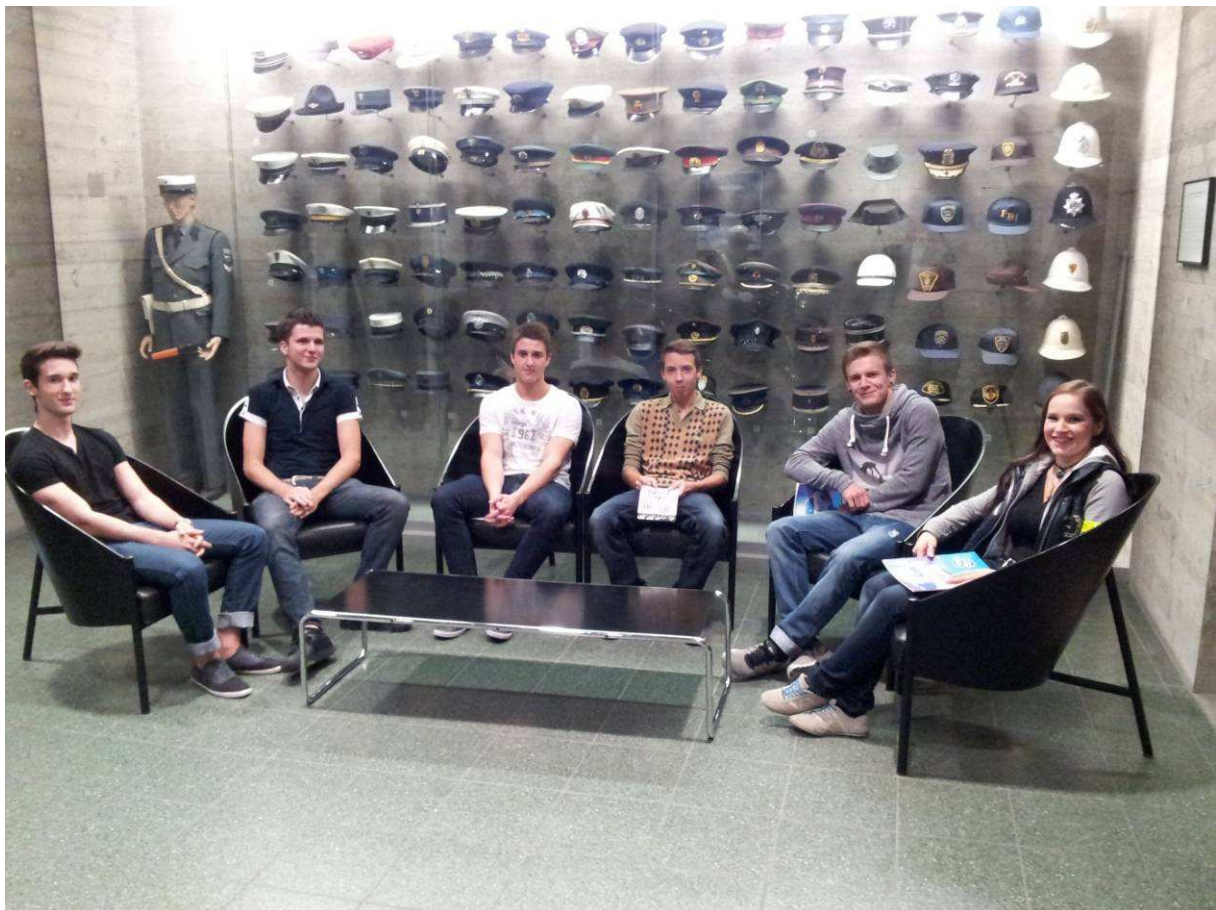
Die gut gelaunten Teilnehmer der Jungbürgerfeier 2012 bei der Mobilien Einsatzpolizei (MEPO).