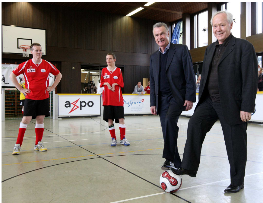
Köbi Kuhn und Ottmar Hitzfeld mit Spielern beim zweiten Football for all-Turnier in der Rehaklinik Bellikon.

Am Samstag, 5. Mai 2012, findet in der Rehaklinik Bellikon das dritte Hallenfussballturnier für Spieler mit Handicap statt. Auch die Rehaklinik Bellikon wird mit einem Team vertreten sein. Prominente Unterstützung erhält sie voraussichtlich von Köbi Kuhn, Alain Sutter, Gilbert Gress und weiteren Fussballgrössen. Gespielt wird von 10.30 bis 15.00 Uhr - Zuschauer sind herzlich willkommen! Weitere Informationen finden Sie unter www.rehabellikon.ch