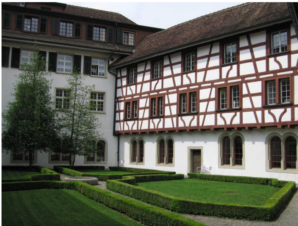
Kloster Gnadenthal, Kreuzgang-Innenhof

Vom Frauenkonvent über die Zigarrenfabrik bis zum grössten Pflegezentrum im Kanton Aargau