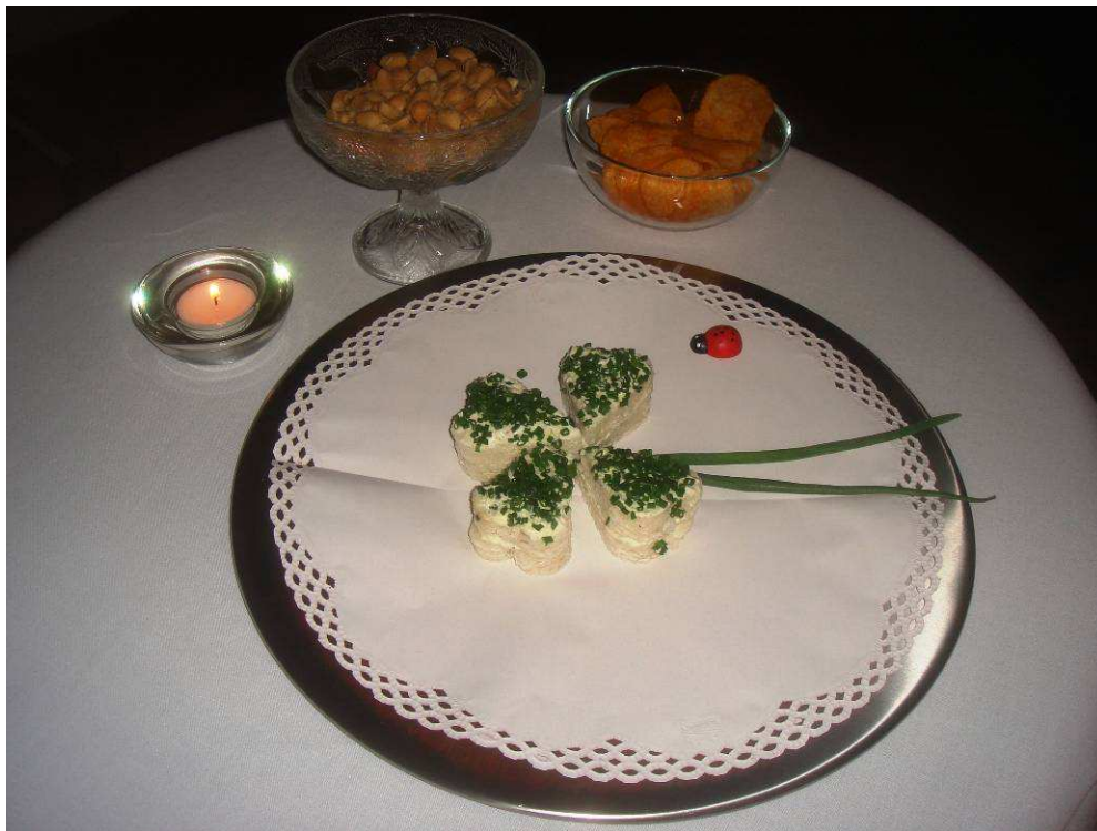
Die bildlichen Glückwünsche zum „Prosit-Neujahr“