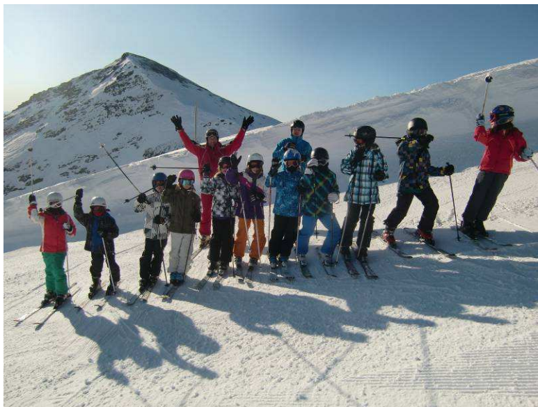
Auf dem Gletscher dick eingepackt

Das diesjährige Skilager fand im wunderschönen, tief verscheiten Flims/Laax statt. Unsere Unterkunft, die Nagenshütte auf über 2000 Meter ü. M. war einmal mehr unser Ausgangspunkt für die schönen Ski- und Snowboardtage. Bei herrlichem Sonnenschein und besten Schneebedingungen fuhren wir die ersten drei Tage was das Zeug hielt. Es zog uns alle automatisch auf die Piste - drin bleiben wollte keiner. Während die Einsteiger das Ski- und Snowboardfahren erlernten und die ersten (Sturz) Erfahrungen machten, waren alle anderen Kids in unterschiedlichen Gruppen auf den Pisten vom schönen Skigebiet unterwegs.