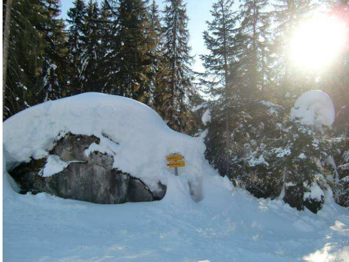
Schnee in rauen Mengen....