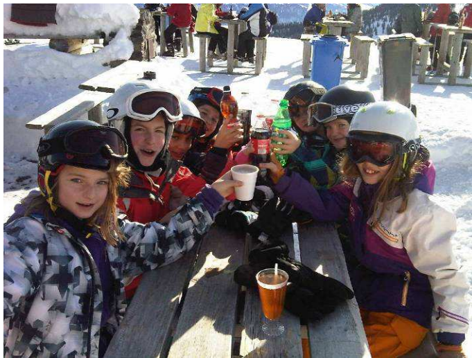
Ein kleiner Beizlistopp durfte natürlich auch nicht fehlen...

Am Donnerstag, als das Wetter dann umschlug, wurde das alljährliche Ski- und Snowboardrennen durchgeführt. Nebst den schnellsten wurden auch jene bewertet, die beide Läufe möglichst in der gleichen Zeit absolvierten. Und da gewann jemand, der erst seit dem Beginn des Lagers auf den Skiern stand.