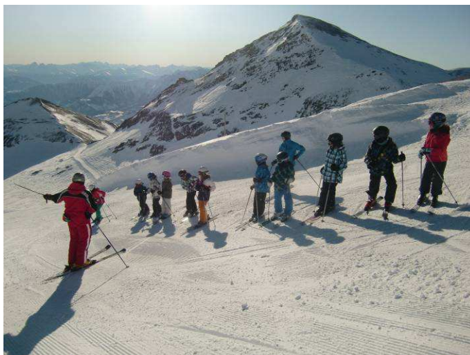
Seine kleine Gletscherkunde gehörte auch dazu. Alle hören zu (oder sind sie eingefroren?)

Am Donnerstag, als das Wetter dann umschlug, wurde das alljährliche Ski- und Snowboardrennen durchgeführt. Nebst den schnellsten wurden auch jene bewertet, die beide Läufe möglichst in der gleichen Zeit absolvierten. Und da gewann jemand, der erst seit dem Beginn des Lagers auf den Skiern stand.