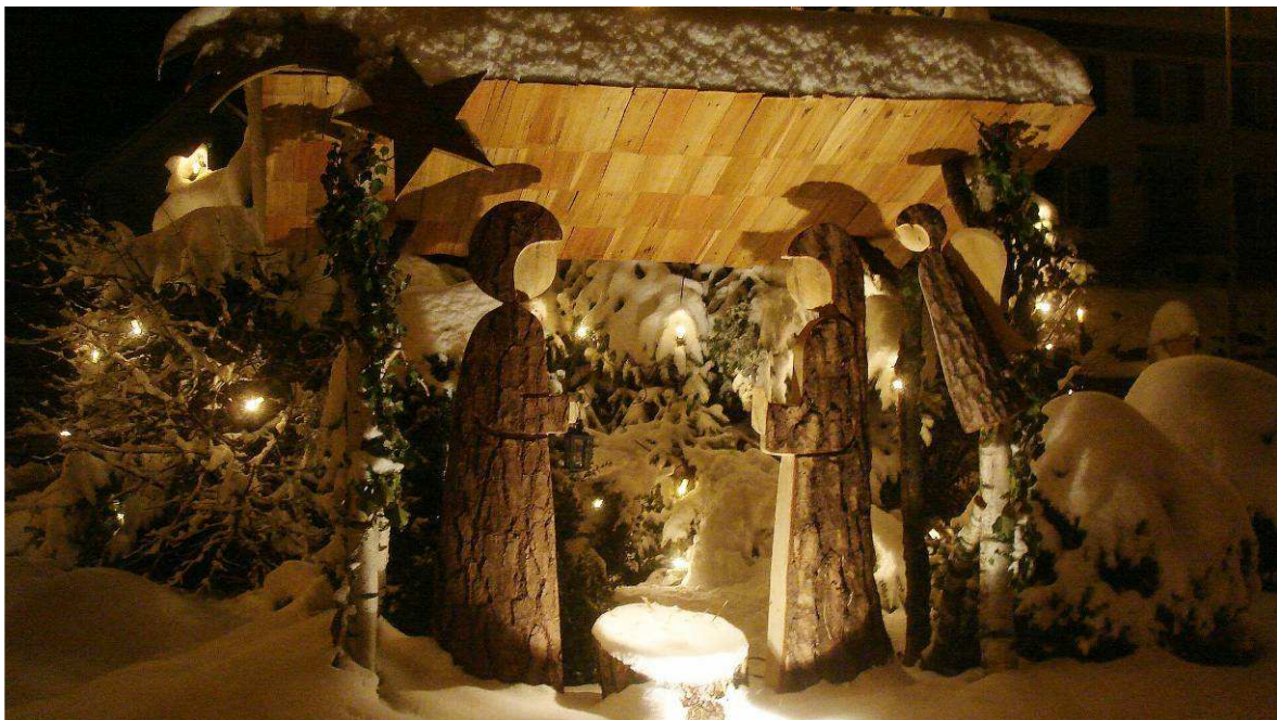
Unser traumhafter Kreislauf im Schnee, am 19.12.2008“

Museumsverein Bellikon und Gemeinderat → www.mvb.mffa.ch