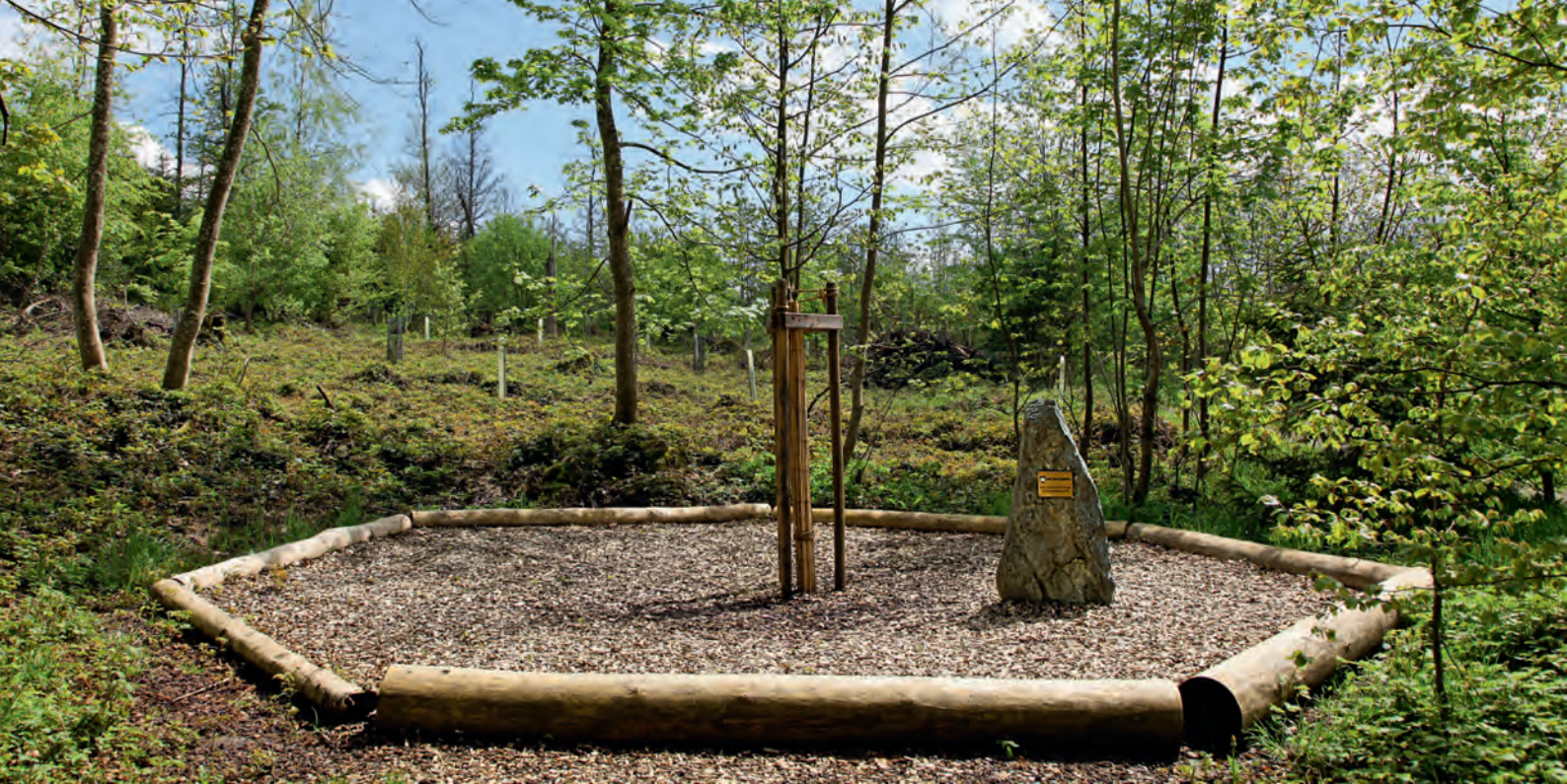
Jubiläumslinde und Gedenkstein «950 Jahre Bellikon» bei der Waldhütte