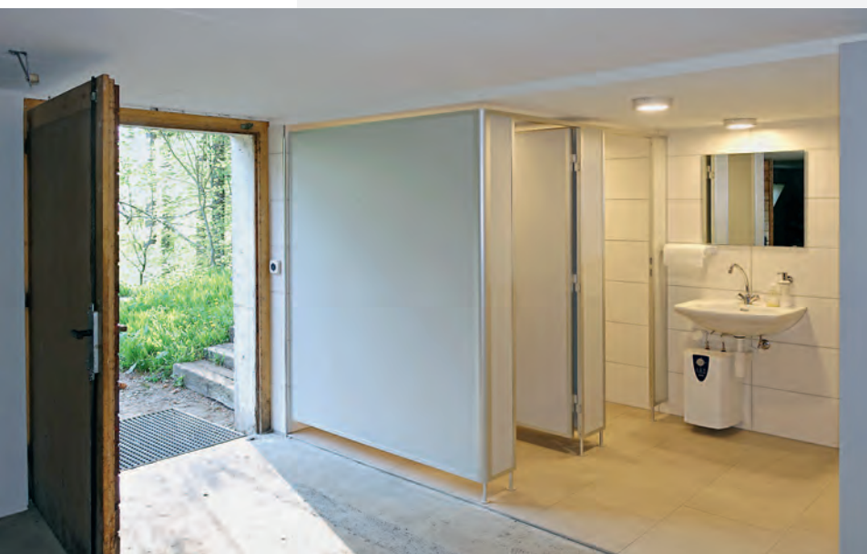
WC-Anlage mit Lavabo und Warmwasserboiler