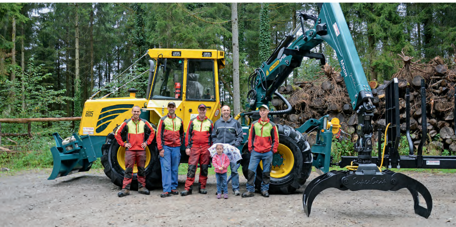
Das Team vom Forstrevier Heitersberg bei der Übergabe des neuen Forstfahrzeugs

Die Jahresrechnung 2014 sei zu genehmigen.