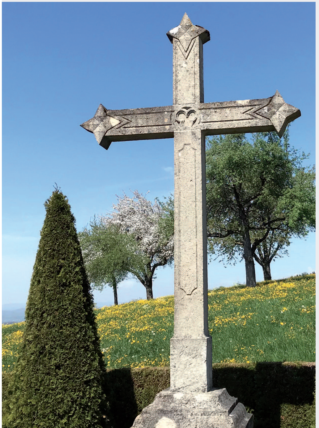
Steinkreuz beim Friedhof Bellikon

Das teilrevidierte Bestattungs- und Friedhofsreglement der Gemeinde Bellikon sei zu genehmigen.