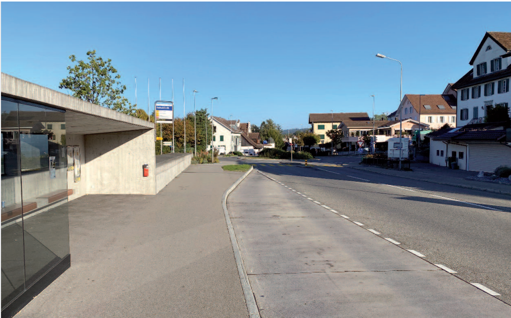
Mutschellenstrasse K411 auf Höhe der Bushaltestelle «Rehaklinik»