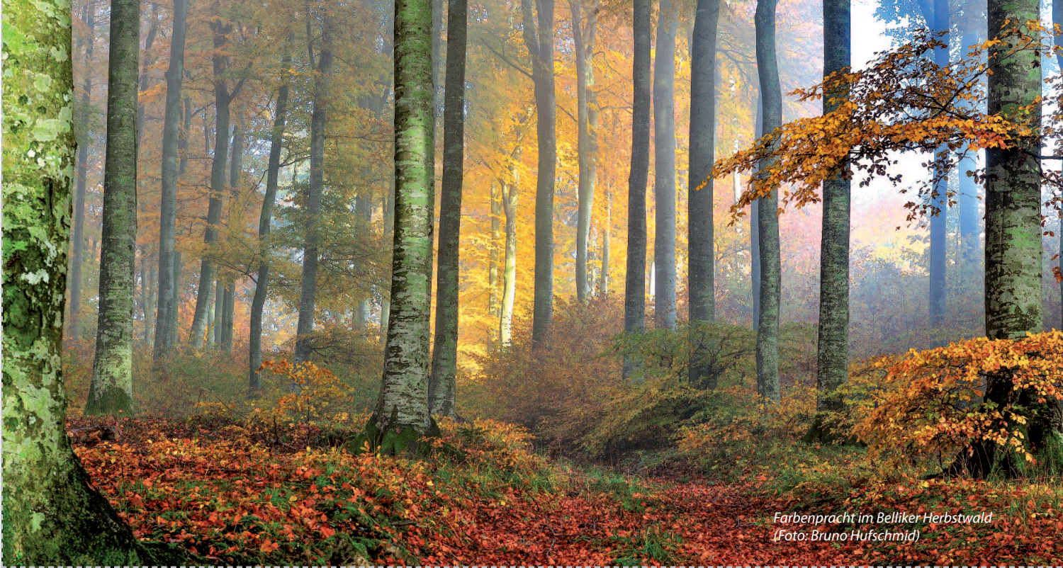
Farbenpracht im Belliker Herbstwald