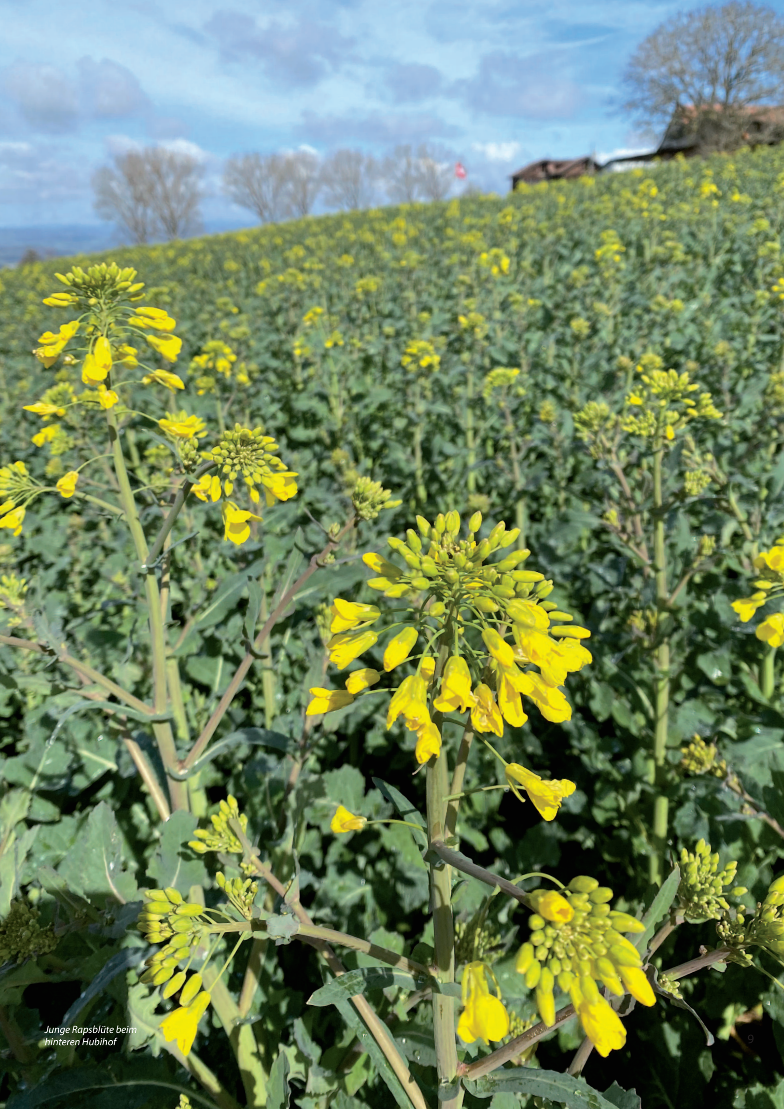
Junge Rapsblüte beim hinteren Hubhof