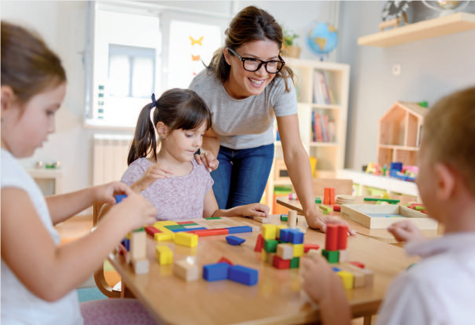
Kinderbetreuung in der Tagesstätte (Symbolbild)

Da die Kosten von der Anzahl besuchter Module abhängig sind, soll die von der Gemeindeversammlung festgelegte Gebühr durch den Gemeinderat während einer Dauer von fünf Jahren um maximal 30% überschritten werden können. Der Gemeinderat möchte aus Gründen der Praktikabilität davon absehen, die Gebühren jährlich durch die Gemeindeversammlung genehmigen zu lassen. Das Reglement soll ab dem Schuljahr 2023/24 in Kraft treten.