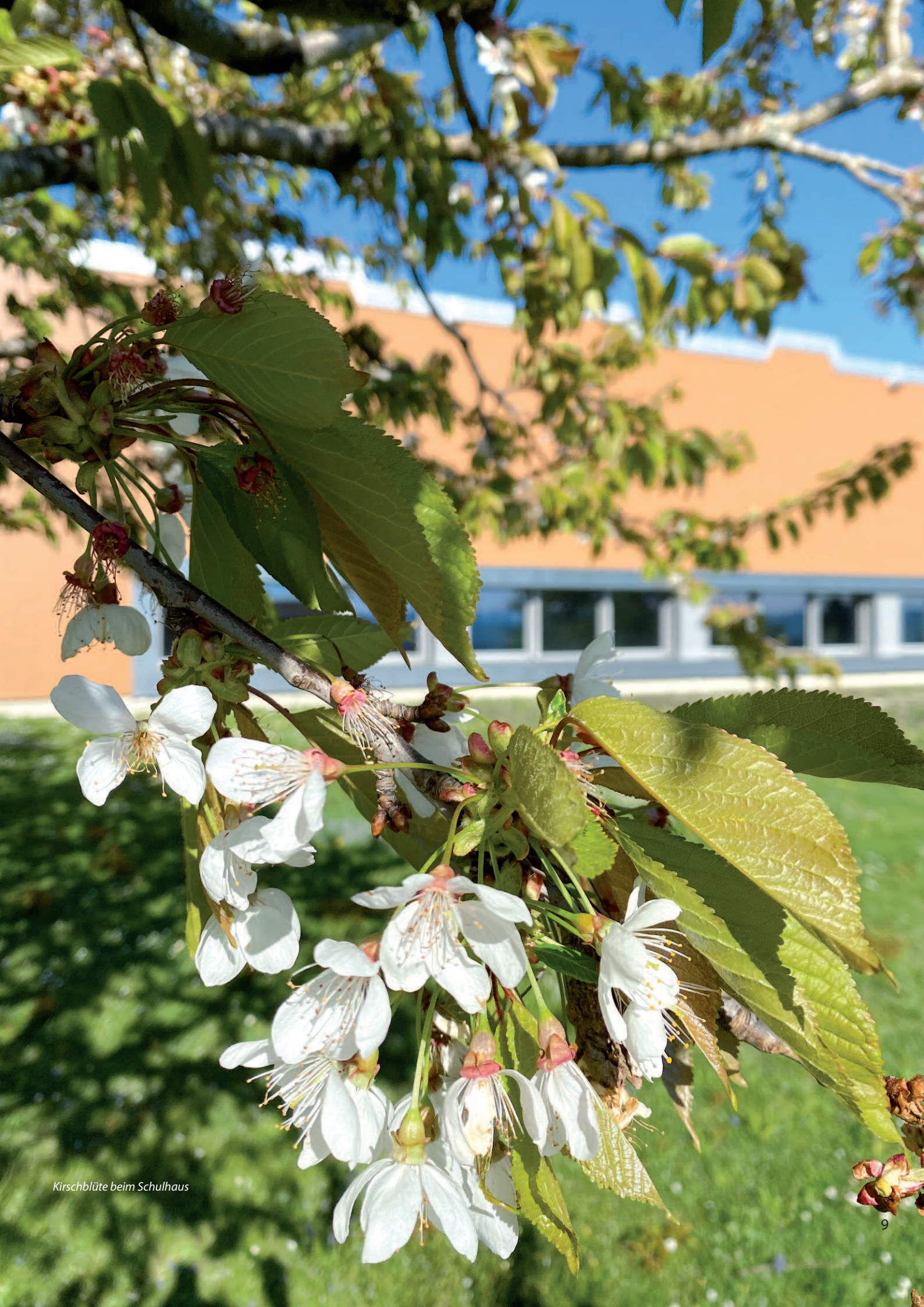
Kirschblüte beim Schulhaus