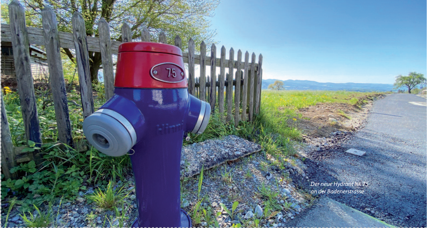
Der neue Hydrant Nr. 75 an der Badenerstrasse