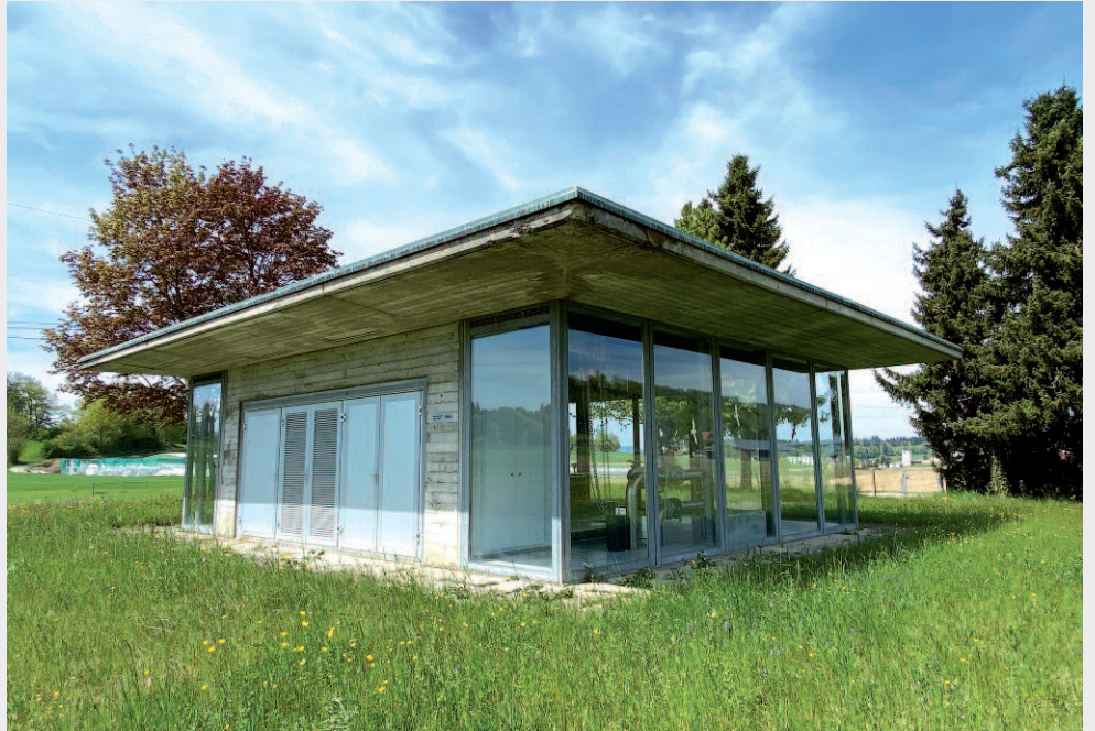
Das sanierungsbedürftige Grundwasserpumpwerk Weid