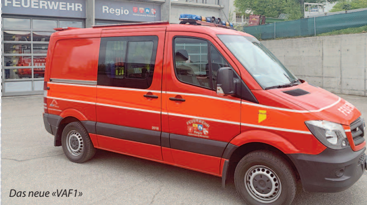
Das neue «VAF1»