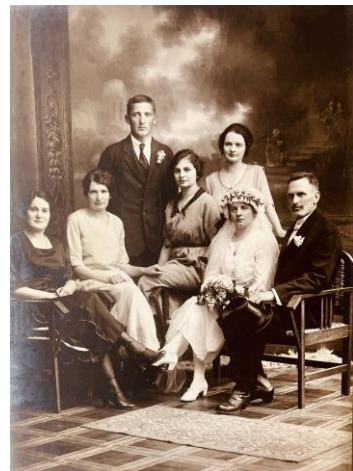
Legende zum Foto: Eine Belliker-Familie als auffälliger Hingucker...