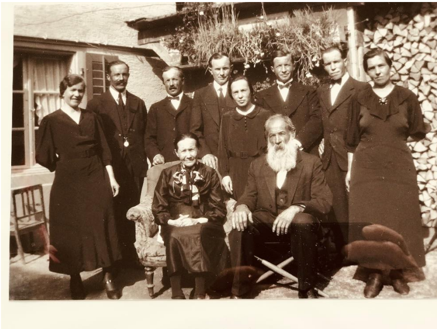
Gutes Beispiel einer Grossfamilie